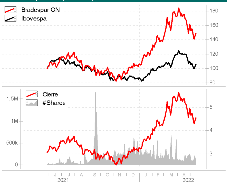
Gráfico de precios (252 días) - Euros