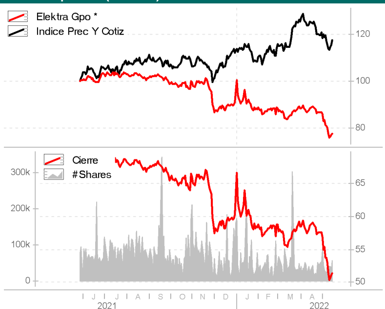
Gráfico de precios (252 días) - Euros